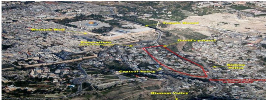
Şekil 5. Michaelerplatz Arkeolojik Parkı (Avusturya) (Anonymous. 2015c), Şekil 6. Tenochtitlan Arkeolojik Parkı (Meksika) (Anonymous. 2015 d), Şekil 7. Kudüs Arkeolojik Parkı (İsrail) (Anonymous. 2015 e)