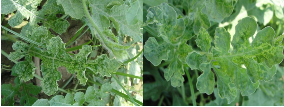
Şekil 2. Arazide karpuz bitkileri yapraklarında mozayik, sararma, kabarcıklıklar ve deformasyon belirtileri