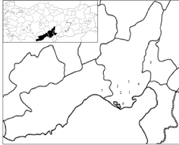
Şekil 1. Adana, Mersin ve Osmaniye illerinde survey çalışmasının yürütüldüğü alanları gösteren harita (Sol köşede yer alan harita Adana, Mersin ve Osmaniye illerinin Türkiye'deki konumunu göstermektedir).

genç yaprak ve sürgün dokuları çalışmada materyal olarak kullanılmıştır.