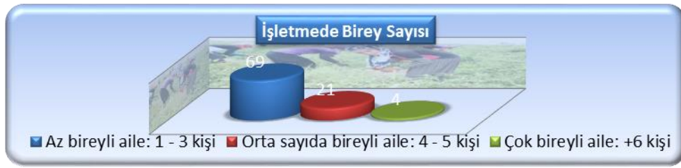
Şekil 2. İncelenen işletmelerde aile