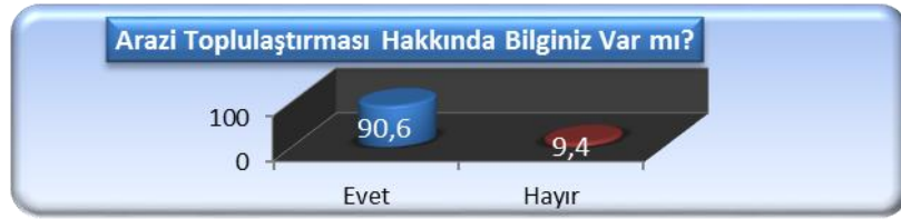
Şekil 5. AT hakkında tarımsal işletmelerin bilinç düzeyi

İşletme sahiplerinin çoğunluğu toplulaştırma sonrasında sulama yönteminde değişikliğe gitmediklerini ifade etmiş ve arazi toplulaştırılması hakkında olumlu görüşe sahip olduklarını belirtmişlerdir (Çizelge 2).