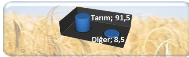
Şekil 3. İşletme sahibinin ana uğraşı

Toplulaştırma öncesi ve sonrası işletme başına düşen parsel sayıları incelendiğinde parsel sayısındaki azalış dikkat çekicidir (Şekil 4). Toplulaştırma öncesi işletme başına parsel sayısı 10 parçaya kadarken, proje sonrası en fazla 5 parsel indirilmiştir. Toplulaştırma sonrası işletmelerin % 78'inin parsel sayısı 1-3 parça arasındadır.