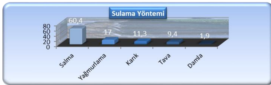
Şekil 6. AT öncesi tarımsal işletmelerin sulama yöntemleri