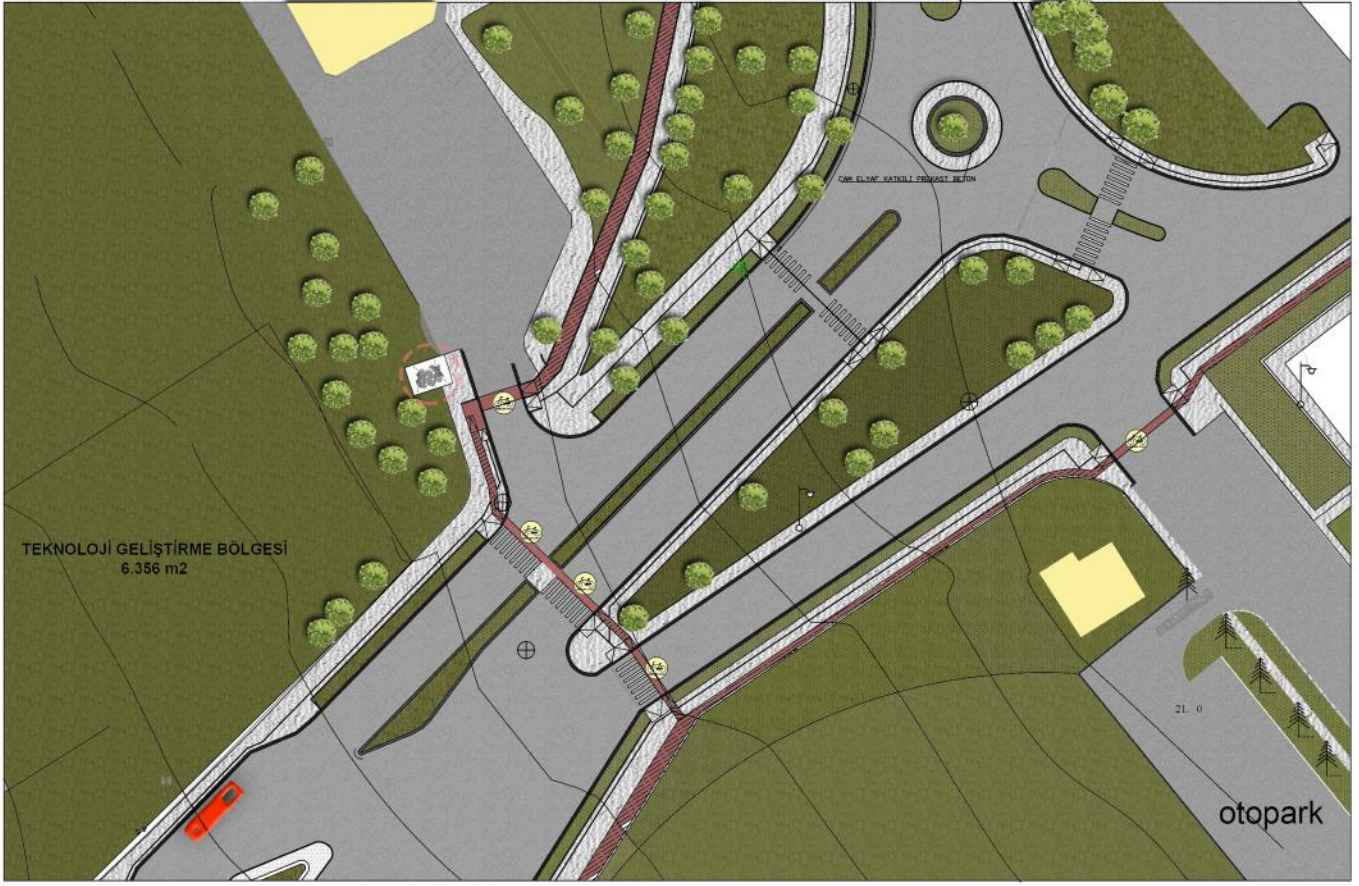
VAZİYET PLANI Ö:1/500