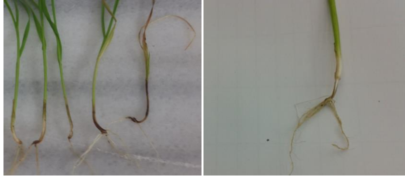
Şekil 3. Fidelerde toprak kaynaklı (sol) ve tohum kaynaklı enfeksiyon (sağ)