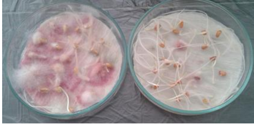
Şekil 2: F. culmorum ile enfekteli tohumlara tebuconazole+metalaxyl-M etkili maddeli fungusit uygulanması (sağ) ve kontrol (sol)