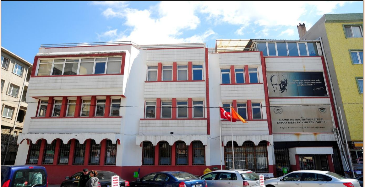
Resim 25: Saray Meslek Yüksekokulu Binası

Saray Meslek Yüksekokulu, 17.03.2006 tarih ve 26111 sayılı Resmi Gazete'de yayınlanan 5467 Sayılı Kanun ile 2809 Sayılı "Yükseköğretim Kurumları Teşkilatı Kanunu"na eklenen EK MADDE 62 gereği Trakya Üniversitesi Rektörlüğü'nden ayrılarak "Namık Kemal Üniversitesi" ne bağlanmıştır.