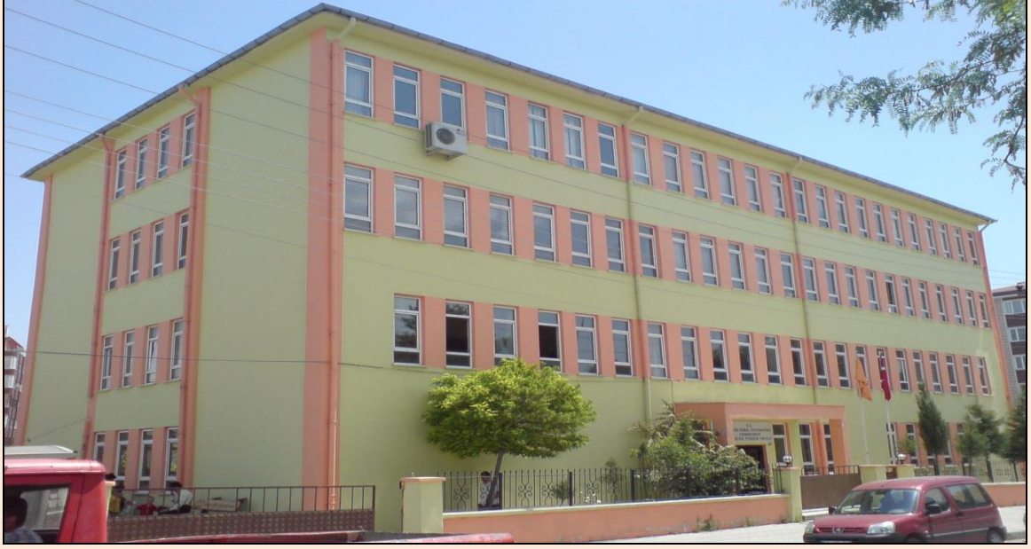
Resim 24: Çerkezköy Meslek Yüksekokulu Binası