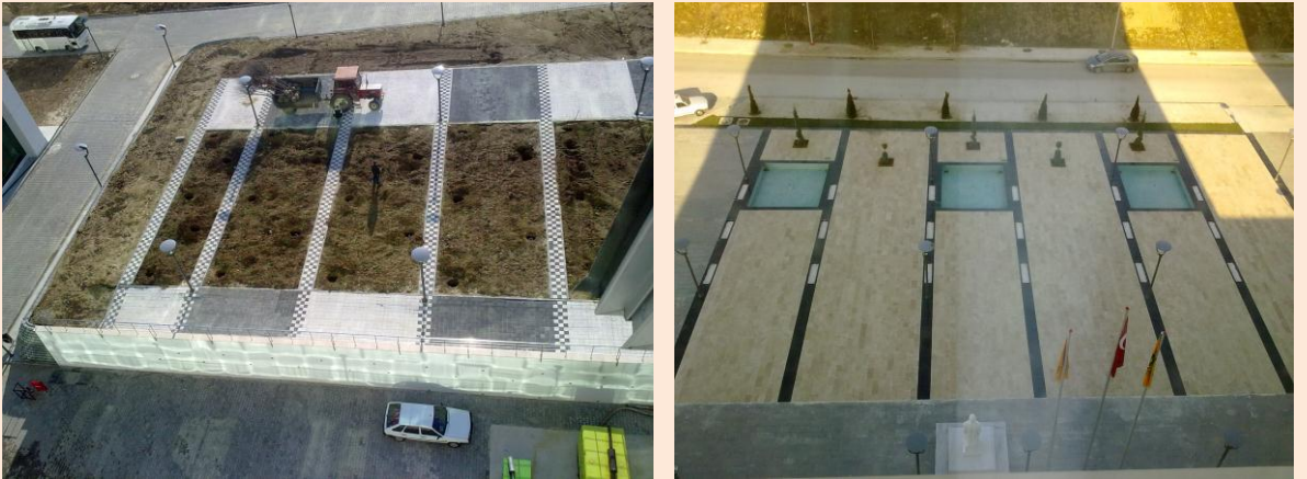
Resim 31: Rektörlük Otopark ve Bina Giriş Yolları