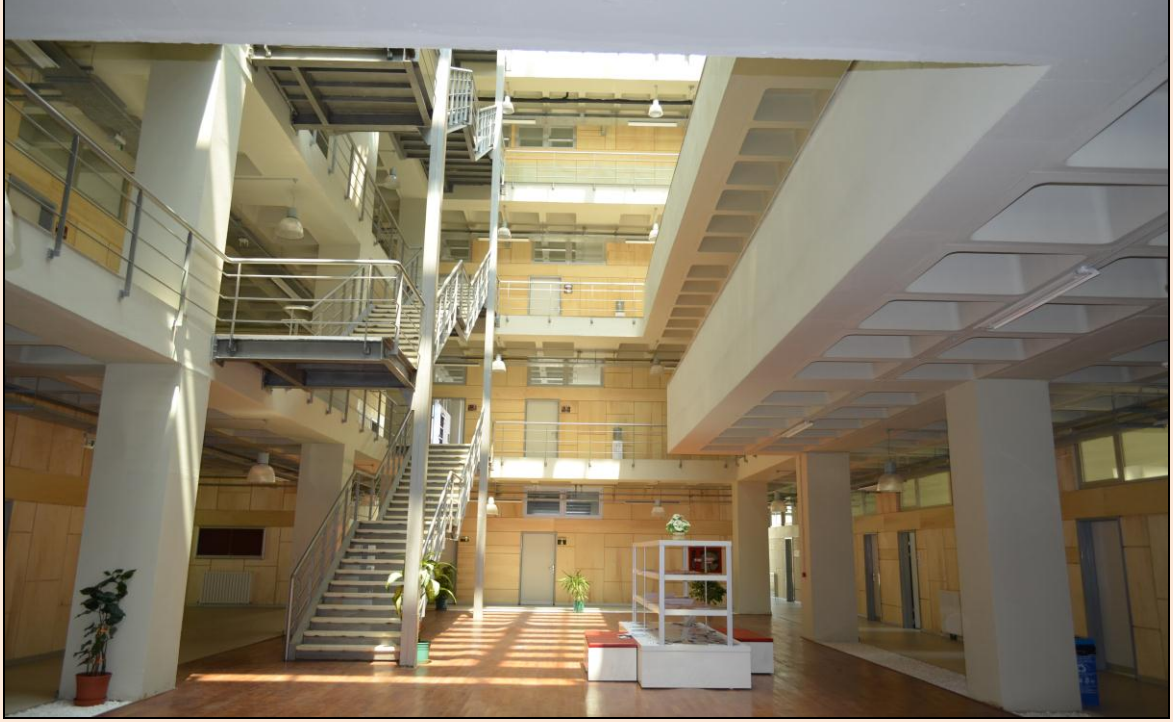
Resim 16: Morfoloji Binası Sağlık Yüksekokulu Kısmı