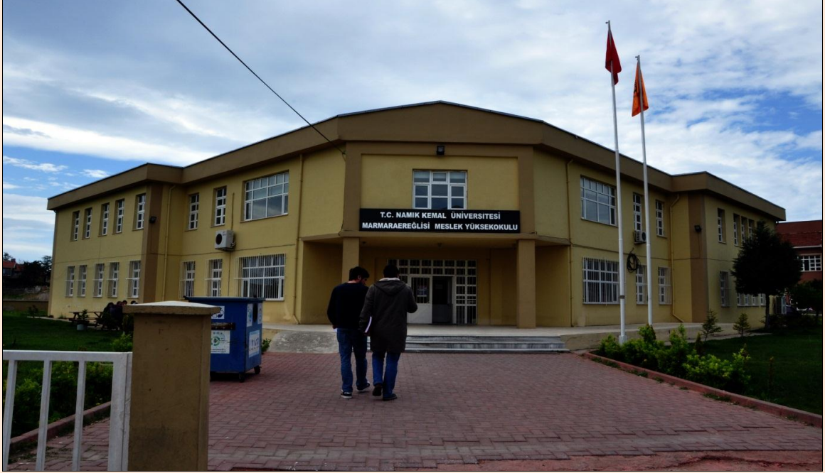
Resim 27: Marmara Ereğlisi Meslek Yüksekokulu Binası