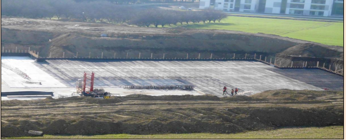
Resim 34: Öğrenci Yaşam Merkezi İnşaatı