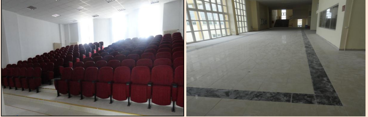
Resim 32: Çorlu Müh.Fak.Tadilat İşleri