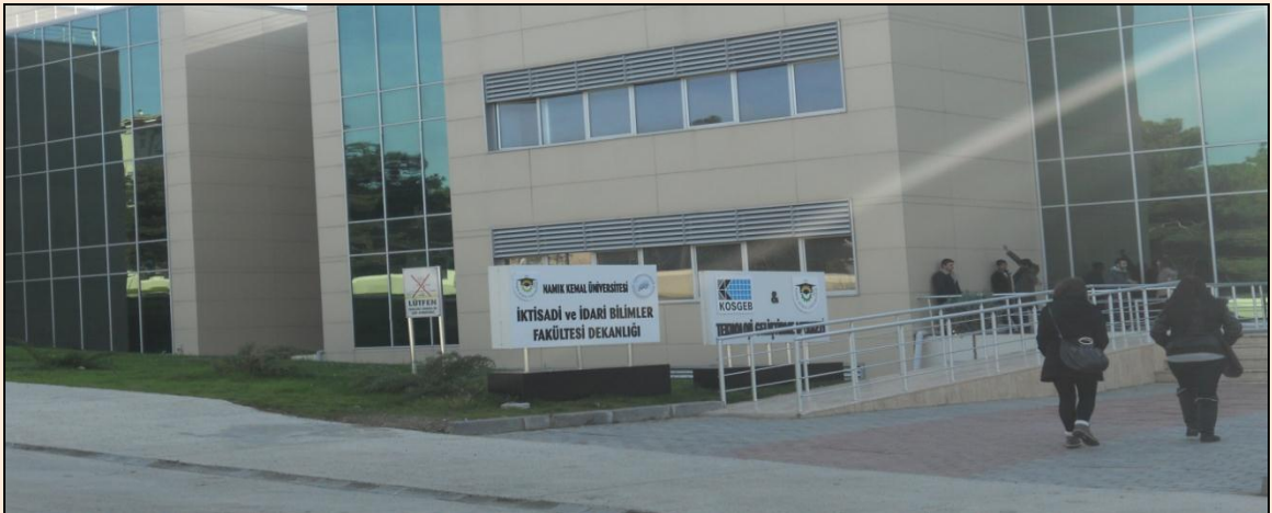
Resim 14: Merkezi Derslikler İktisadi ve İdari Bilimler Fakültesi Kısmı

Fakültede İşletme Bölümü, Çalışma Ekonomisi ve Endüstri İlişkileri Bölümü, İktisat Bölümü, Uluslararası İlişkiler Bölümü olmak üzere 4 bölüm bulunmaktadır.