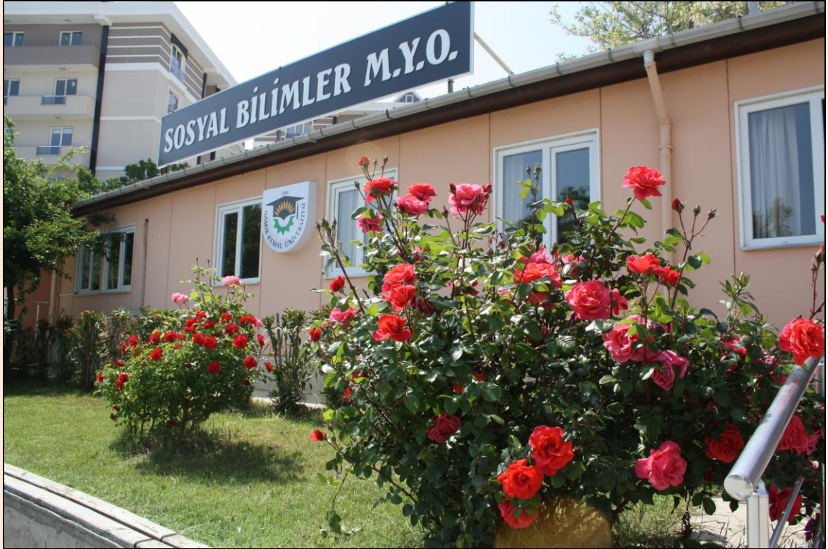
Resim 19: Sosyal Bilimler Meslek Yüksekokulu Binası

Sosyal Bilimler Meslek Yüksekokulu 2547 Sayılı Yükseköğretim Kanunu gereğince Yükseköğretim Kurumlarının yeniden teşkilatlanmasını düzenlemek için çıkarılan ve 20 Temmuz 1982 tarihli Resmi Gazete'de yayınlanan 41 Sayılı Kanun Hükmündeki Kararname ile "Tekirdağ Meslek Yüksekokulu" adıyla, yeni kurulan Trakya Üniversitesi Tekirdağ Ziraat Fakültesi Dekanlığı'na bağlanmıştır. 1982-1983 Eğitim-Öğretim yılından itibaren Trakya Üniversitesi Tekirdağ Ziraat Fakültesi Dekanlığı'na bağlı olarak faaliyetini sürdüren Tekirdağ Meslek Yüksekokulu, 2006 yılında yeni kurulan Namık Kemal Üniversitesi'ne bağlanmıştır. Tekirdağ Meslek Yüksekokulu Yükseköğretim Kurulu Başkanlığının 02/05/2008 tarih ve B.30.0.EÖB.0.00.00.03.06.02-1610-011335 sayılı yazısı Sosyal Bilimler Meslek Yüksekokulu ile Teknik Bilimler Meslek Yüksekokulu olarak ikiye ayrılmıştır.