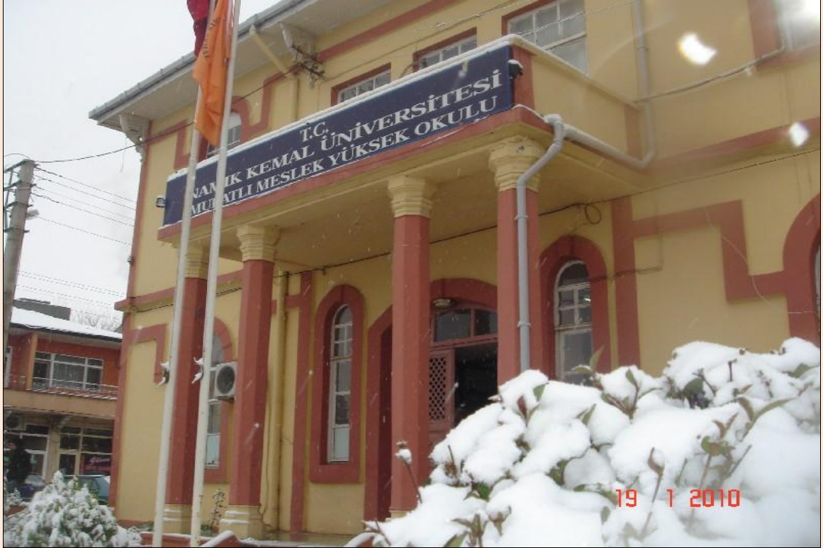
Resim 26: Muratlı Meslek Yüksekokulu Binası

2006 yılında Namık Kemal Üniversitesi'nin kurulmasıyla Trakya Üniversitesi'nden ayrılıp Namık Kemal Üniversitesi'ne bağlanmıştır. Bugün Muhasebe, İşletme, Kimya Teknolojisi ve Maliye olmak üzere 4 bölüm ile Eğitim-Öğretim faaliyetine devam etmektedir.