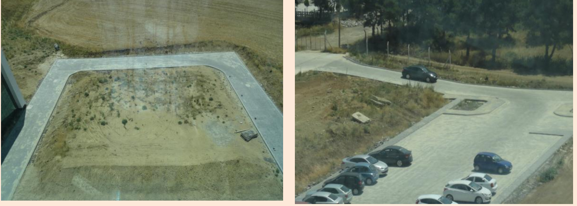
Resim 30: Rektörlük Otopark ve Bina Giriş Yolları