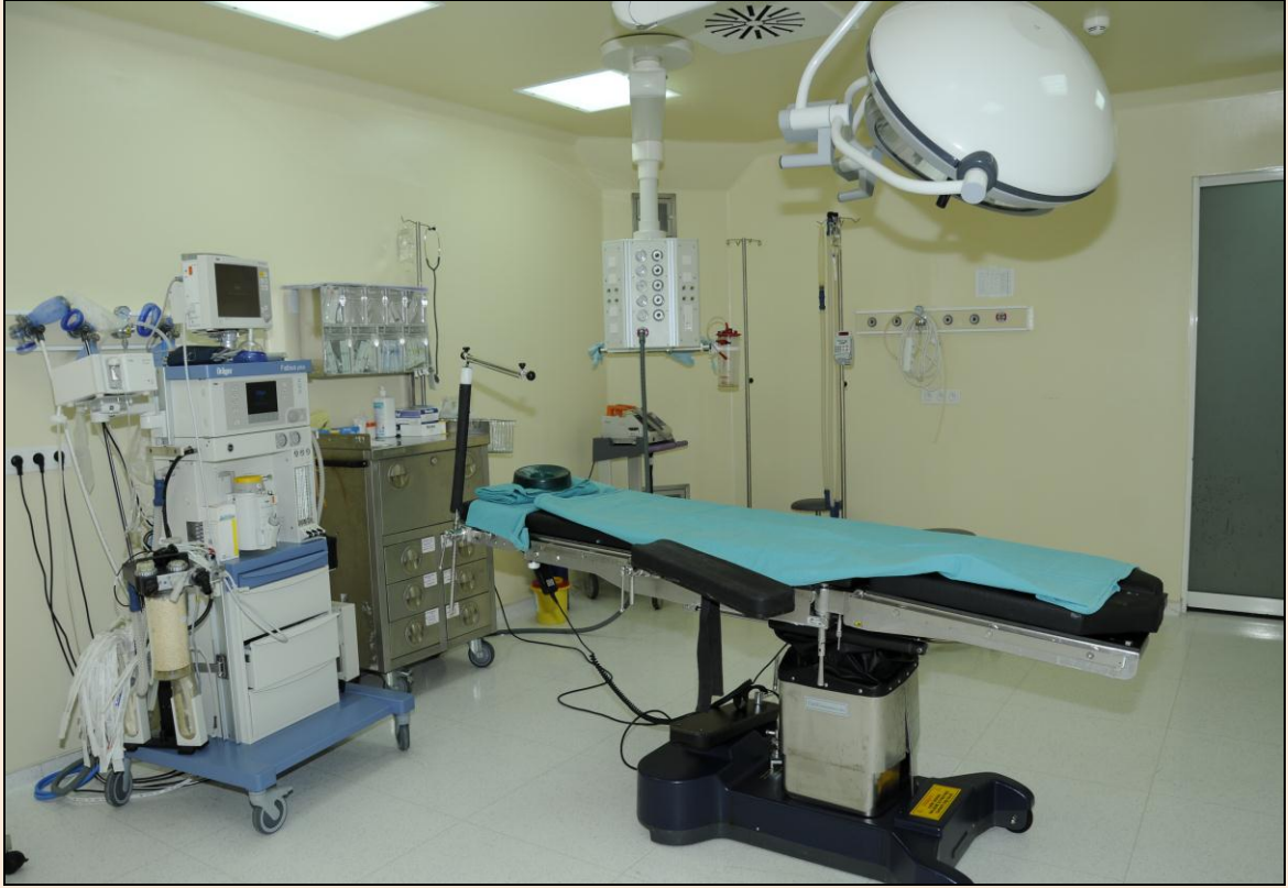
Resim 6: Araştırma ve Uygulama Hastanesi