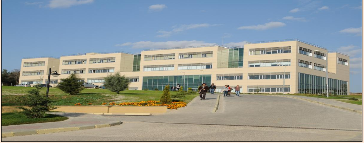
Resim 13: Merkezi Derslikler Fen-Edebiyat Fakültesi Kısmı

Fakültede Biyoloji Bölümü, Fizik Bölümü, Kimya Bölümü, Matematik Bölümü, Türk Dili ve Edebiyatı Bölümü, Tarih Bölümü, Coğrafya Bölümü, Sosyoloji Bölümü, Psikoloji Bölümü, Doğu Dilleri Bölümü (Japon Dili ve Edebiyatı), Fransız Dili ve Edebiyatı Bölümü, İngiliz Dili ve Edebiyatı Bölümü, Alman Dili ve Edebiyatı Bölümü, Amerikan Kültürü ve Edebiyatı Bölümü, Bulgar Dili ve Edebiyatı Bölümü, Çağdaş Yunan Dili ve Edebiyatı Bölümü, İspanyol Dili ve Edebiyatı Bölümü, İtalyan Dili ve Edebiyatı Bölümü, Rus Dili ve Edebiyatı Bölümü olmak üzere 19 bölüm bulunmaktadır.