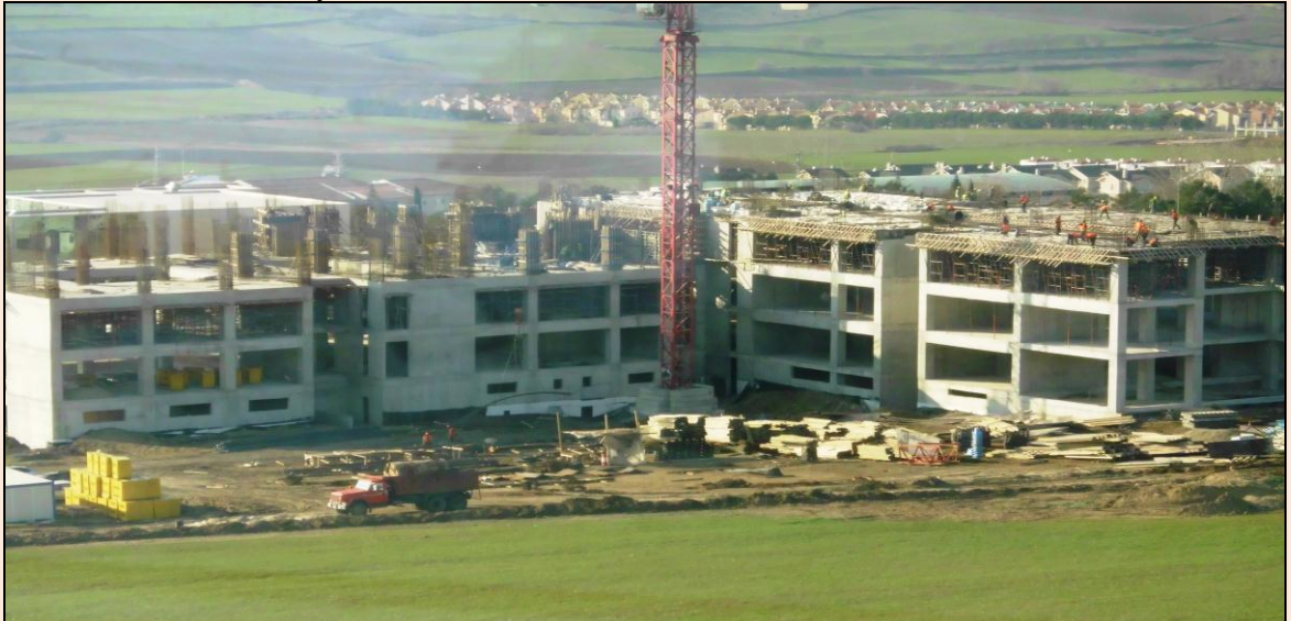
Resim 33: Fen-Edebiyat Fakültesi İnşaatı