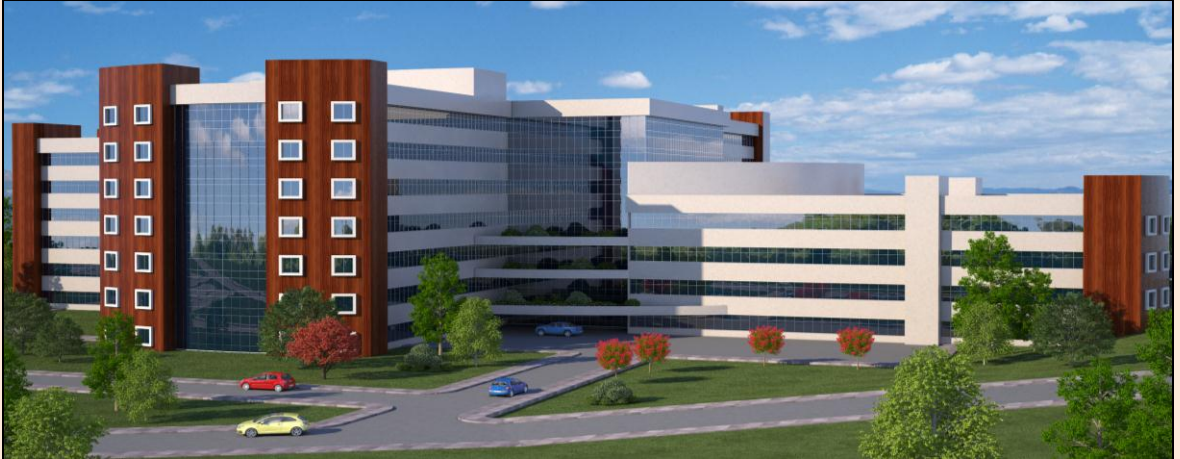
Resim 35: 200 Yataklı Araştırma ve Uygulama Hastanesi Etüd Projesi