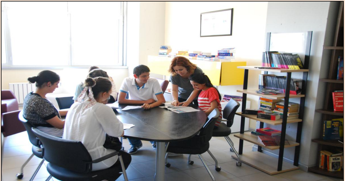
Resim 17: Yabancı Diller Yüksekokulunda Ders Saati

Namık Kemal Üniversitesi'ne bağlı Yabancı Diller Yüksekokulu Milli Eğitim Bakanlığı'nın 26.01.2009 tarihli 2489, 2490 sayılı yazıları üzerine 28.03.1983 tarih ve 2809 Sayılı Kanununun ek 30'uncu Maddesine göre Bakanlar Kurulu Kararıyla 02.02.2009 tarihinde kararlaştırılmış ve 05.03.2009 tarihli Resmi Gazetede yayınlanarak kurulmuştur.