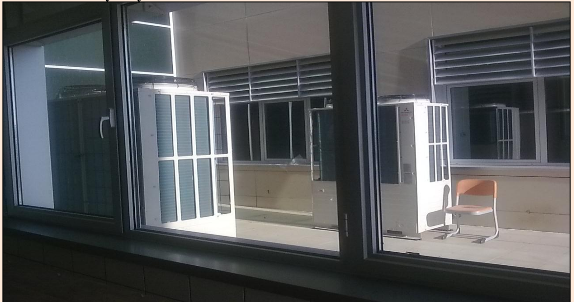
Resim 29: Deney Hayvanları Laboratuvarı Havalandırma Tesisatı